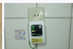
コンセントタイプ